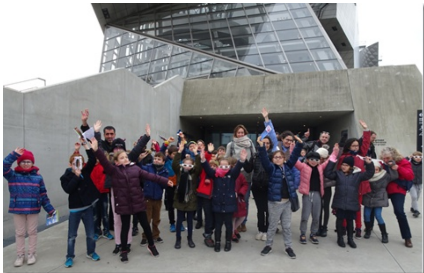
Les enfants de la catéchèse oecuménique en visite au Musée des Confluences