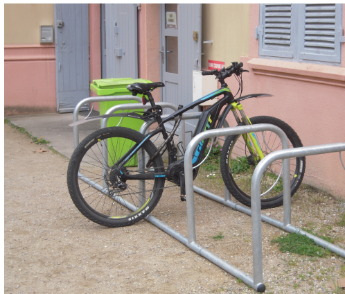
Supports installés à la Sarra pour encourager l'usage des vélos et autres trottinettes...