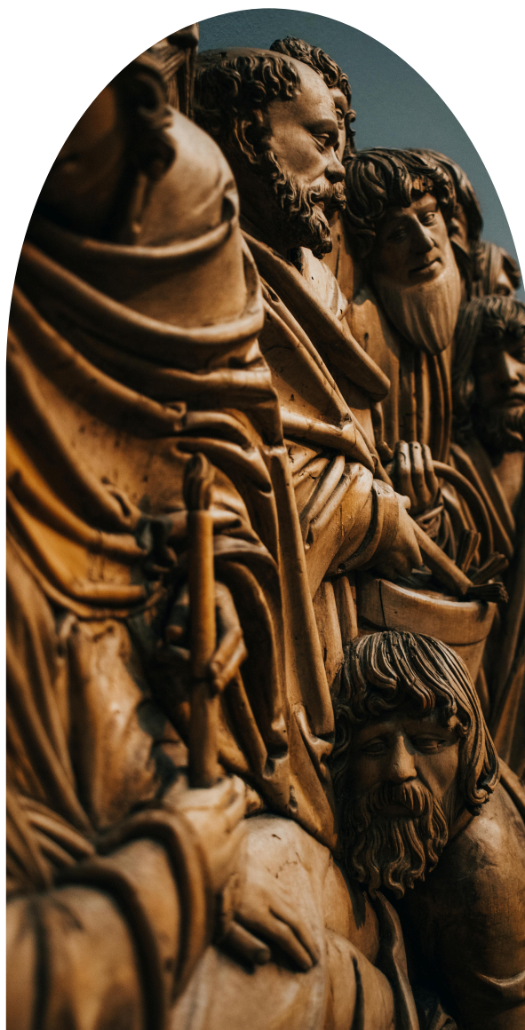
sculpture des apôtres

Les membres de la paroisse qui se sentent appelés ou qui ont été discernés se présentent devant la communauté, lors de l'Assemblée Générale, afin d'être élus par ceux de la paroisse qui sont régulièrement inscrits. Ainsi, entre 6 et 12 conseillers presbytéraux (selon la taille de la paroisse) sont choisis pour 4 ans . Le Pasteur, lui, n'est pas élu mais est appelé à faire partie du Conseil.