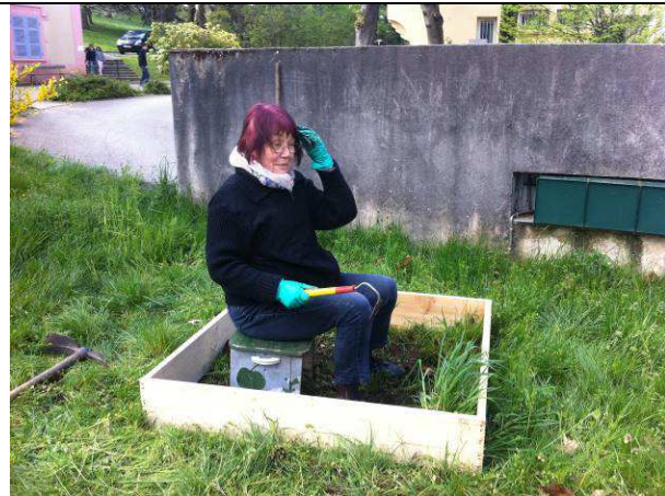
On arrive déjà à faire pousser des Suzanne