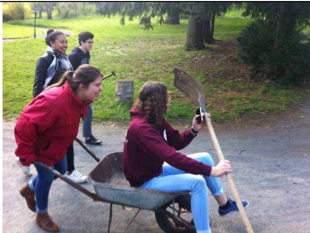
Départ de l'expédition « terre »