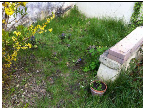
Plants de bourrache pour attirer les abeilles Et de la menthe dans un pot