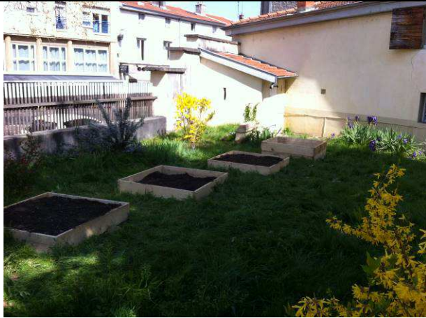
Carrés 1 à 4