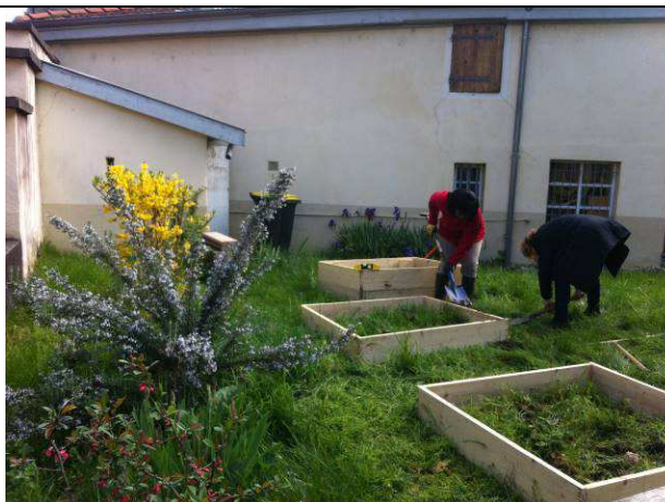
Mise en place des carrés